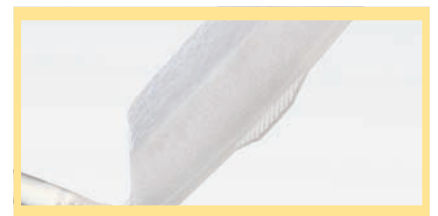
INKONTINENZ-CHIRURGIE Kapitel 9