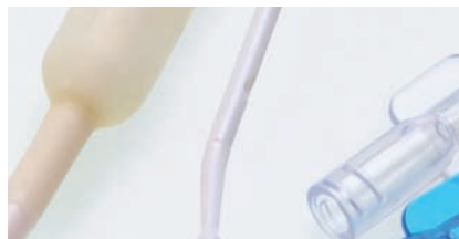
URODYNAMIK Kapitel 8