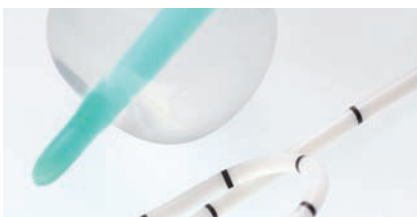
SPEZIALPRODUKTE Kapitel 10