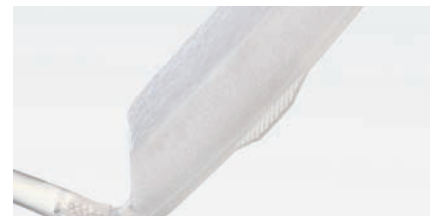
INKONTINENZ-CHIRURGIE Kapitel 9