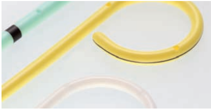
URETERSCHIENEN Kapitel 1