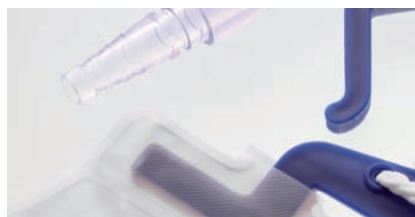
PFLEGETECHNIK Kapitel 11