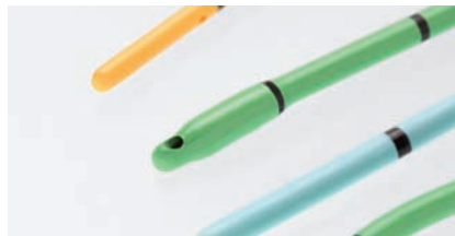
URETERKATHETER Kapitel 5