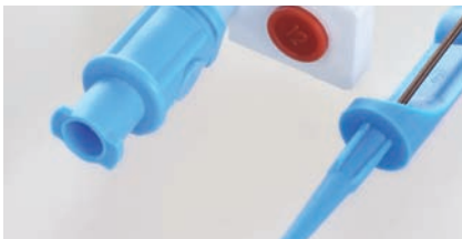
ZUBEHÖR Kapitel 4