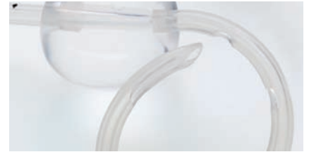
SUPRAPUBISCHE BLASENDRAINAGE Kapitel 3