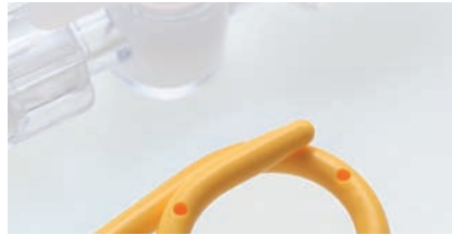
NEPHROSTOMIE Kapitel 2