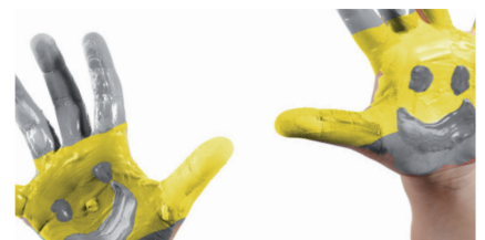
KINDERUROLOGIE Kapitel 12