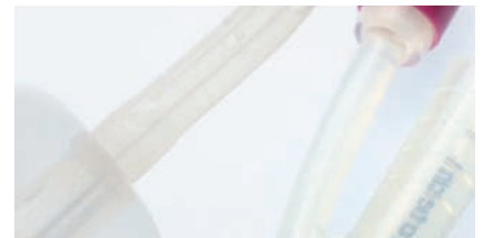
BALLONKATHETER Kapitel 6